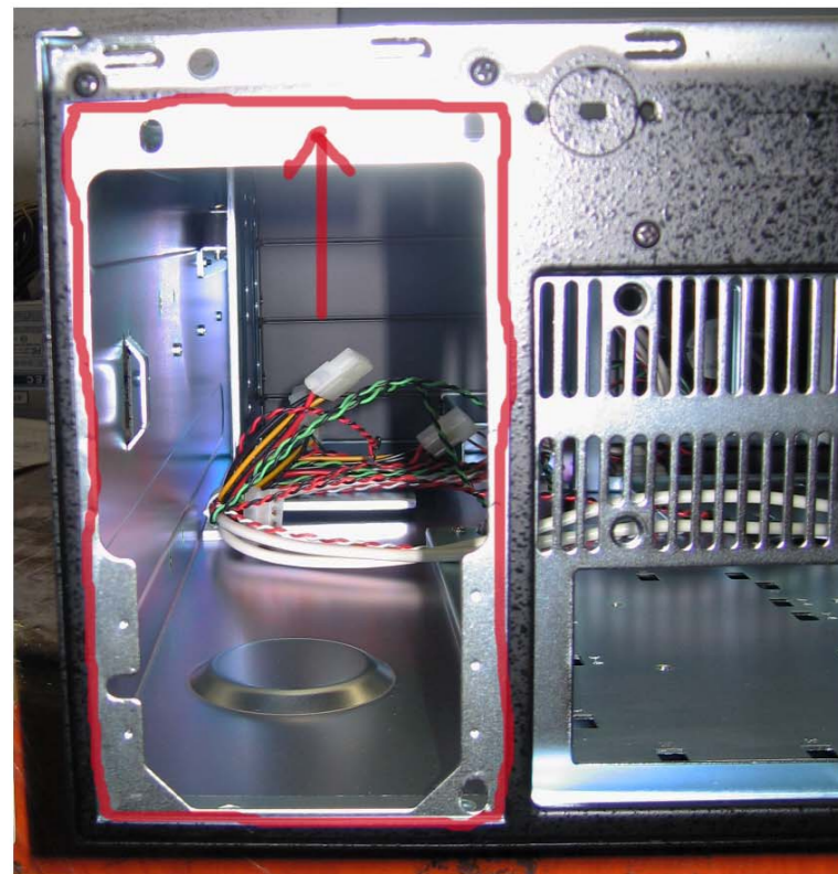
6. Die ATX Blende entfernen