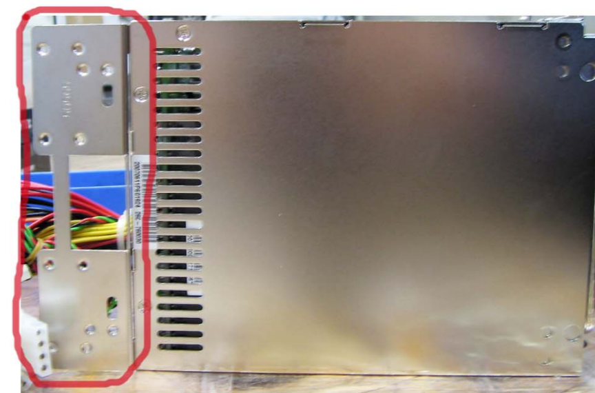
4. Den großen Winkel hinten montieren