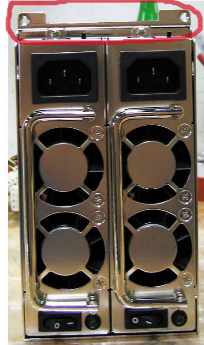
2. Den kleinen Winkel vl. montieren