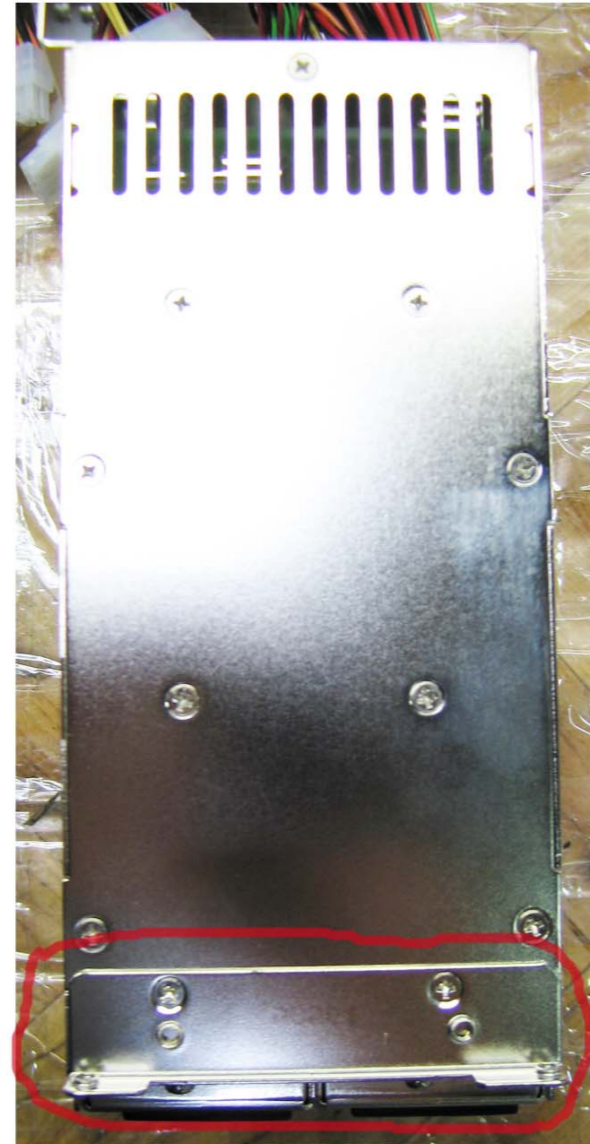
3. Sicht von oben