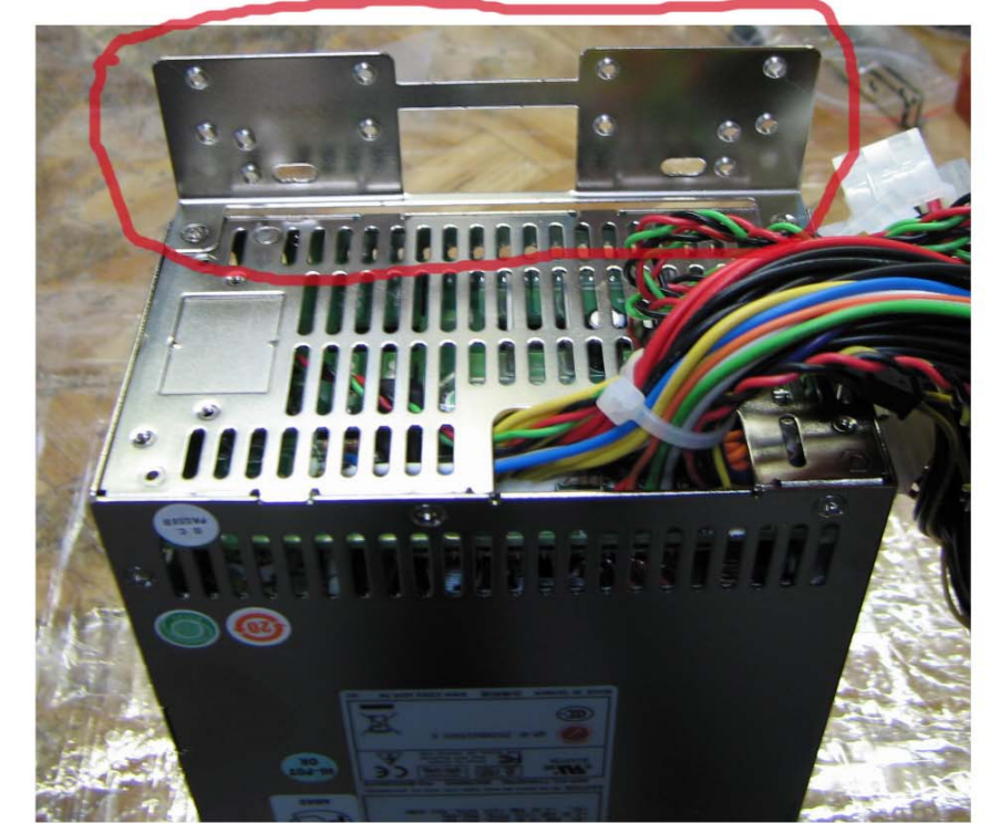
5. Sicht von hinten