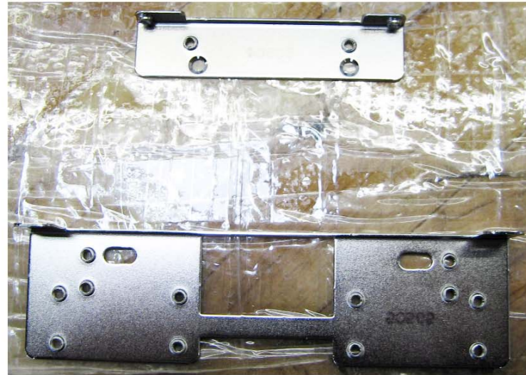
1. Benötigte Winkel